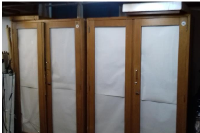
Ormari broj 5 i 10 u stražnjem dijelu zbirke