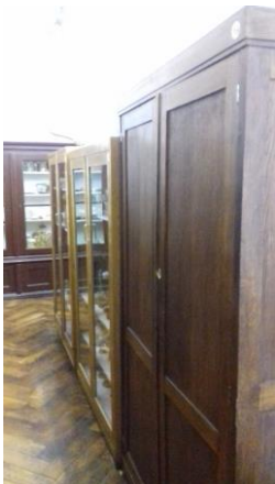
Ormar broj 19