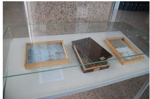
Slika 4. Uloga zbirke u edukaciji i promocija tijekom radionice i izložbe “Knjige na meniju – kukci za stolom”