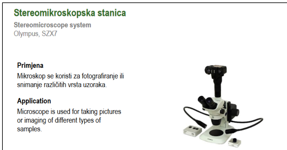
Slika 5. Primjer stereomikroskopske stanice za digitaliziranje