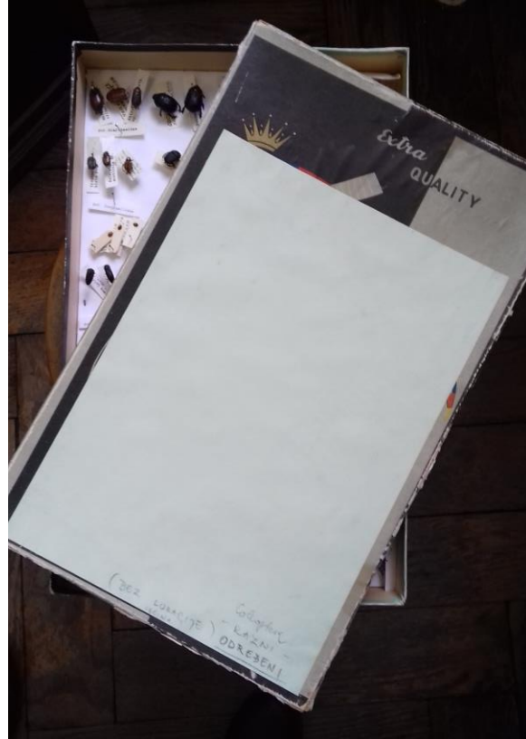
Slika 2. Stare entomološke i priručne kartonske kutije u kojima je pohranjen suhi entomološki materijal.