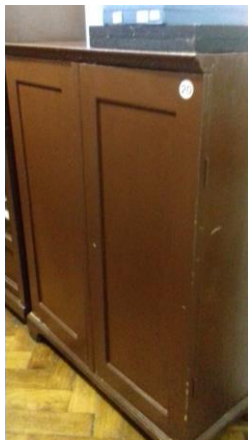
Ormar broj 20